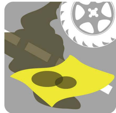
地上・油流出回収